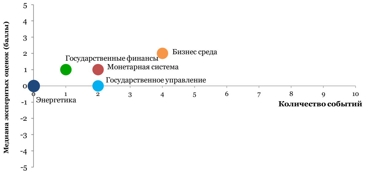
Таблица 1. Оценки всех событий и прогресса реформ по направлениям