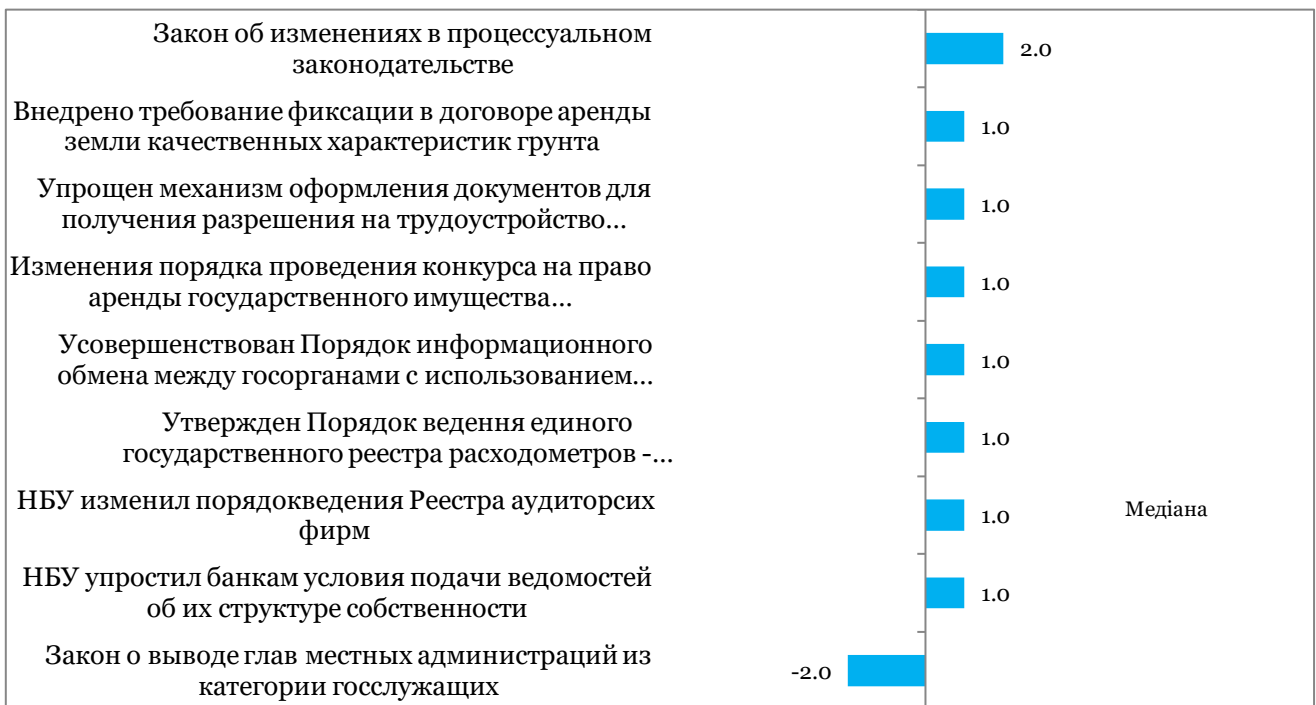
График 3. События, которые определяли значение индекса, оценка события является суммой ее оценок по разным направлениям, поэтому она может превышать +5, или быть меньше -5