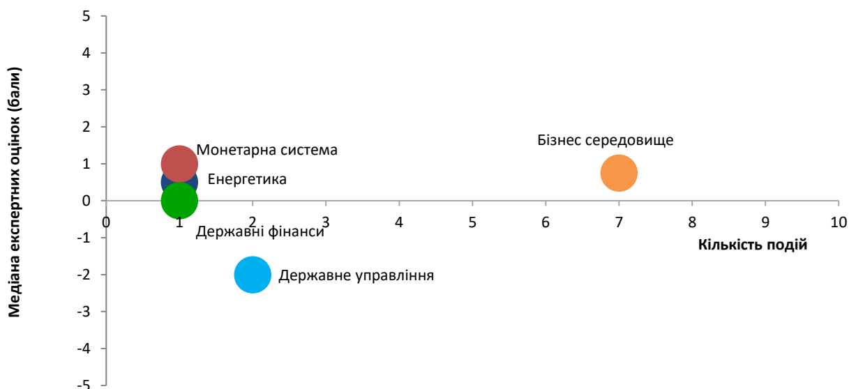
Таблиця 1. Оцінки всіх подій та прогресу реформ за напрямками протягом 20 березня – 2 квітня 2017