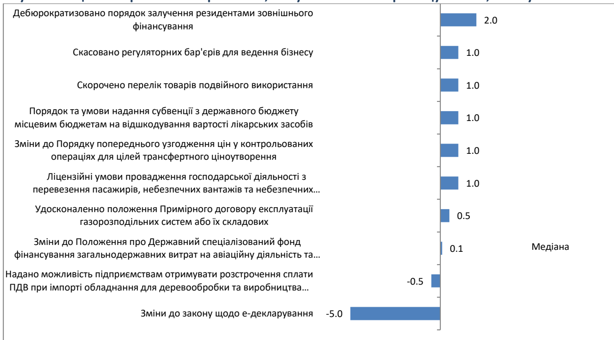
Графік 3. Події, що визначали значення індексу протягом 20 березня – 2 квітня 2017 р., оцінка події є сумою її оцінок за різними напрямками, тому вона може перевищувати +5, або бути меншою за -5