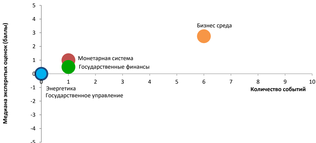
Таблица 1. Оценки всех событий и прогресса реформ по направлениям за период с 21 ноября по 4 декабря