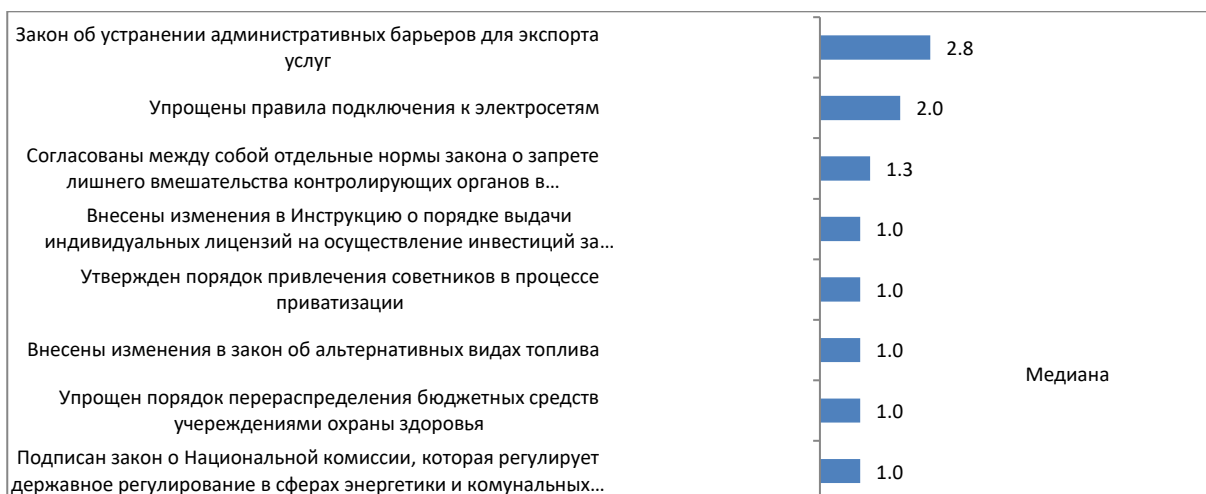
График 3. События, которые определяли значение индекса за период с 21 ноября по 4 декабря 2016г. (оценка события является суммой ее оценок по разным направлениям, поэтому она может превышать +5, или быть меньше -5)

Мария Репко, Центр экономической стратегии