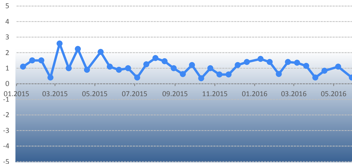
График 1. Динамика Индекса мониторинга реформ*

* Команда іМоРе считает приемлемым темпом реформ уровень индекса 2 и выше