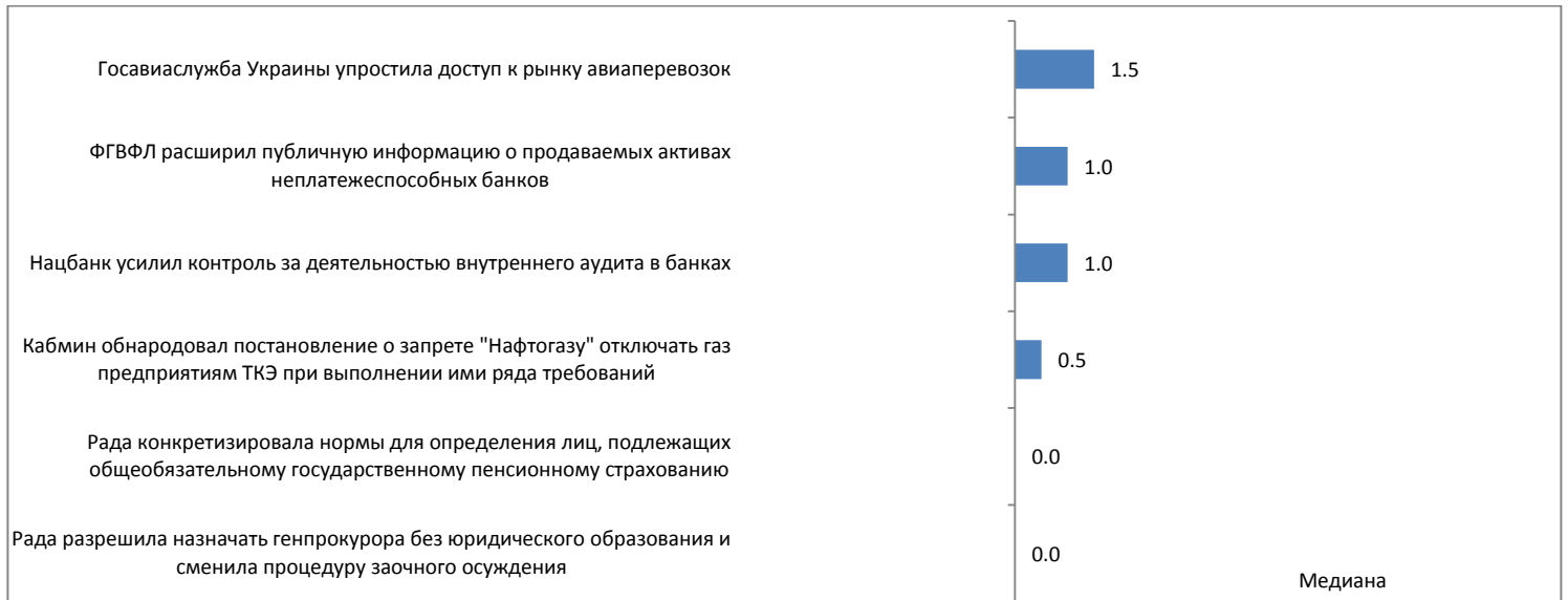
График 4. Значение отдельных компонентов Индекса и количество событий за период 9 – 22 мая 2016г.