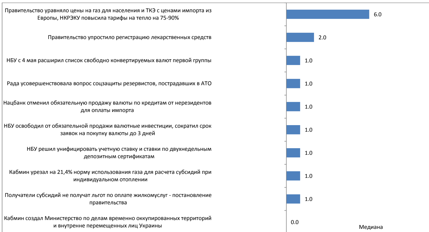
График 4. Значение отдельных компонентов Индекса и количество событий за период 18 апреля – 8 мая 2016г.