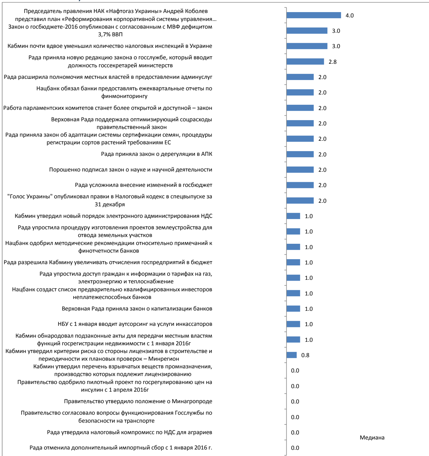
График 4. События, которые определяли значение индекса за период с 21 декабря 2015г. По 10 января 2016г. (оценка события является суммой ее оценок по разным направлениям, поэтому она может превышать +5, или быть меньше -5)

Период мониторинга: 21 декабря 2015 г. – 10 января 2016 г.