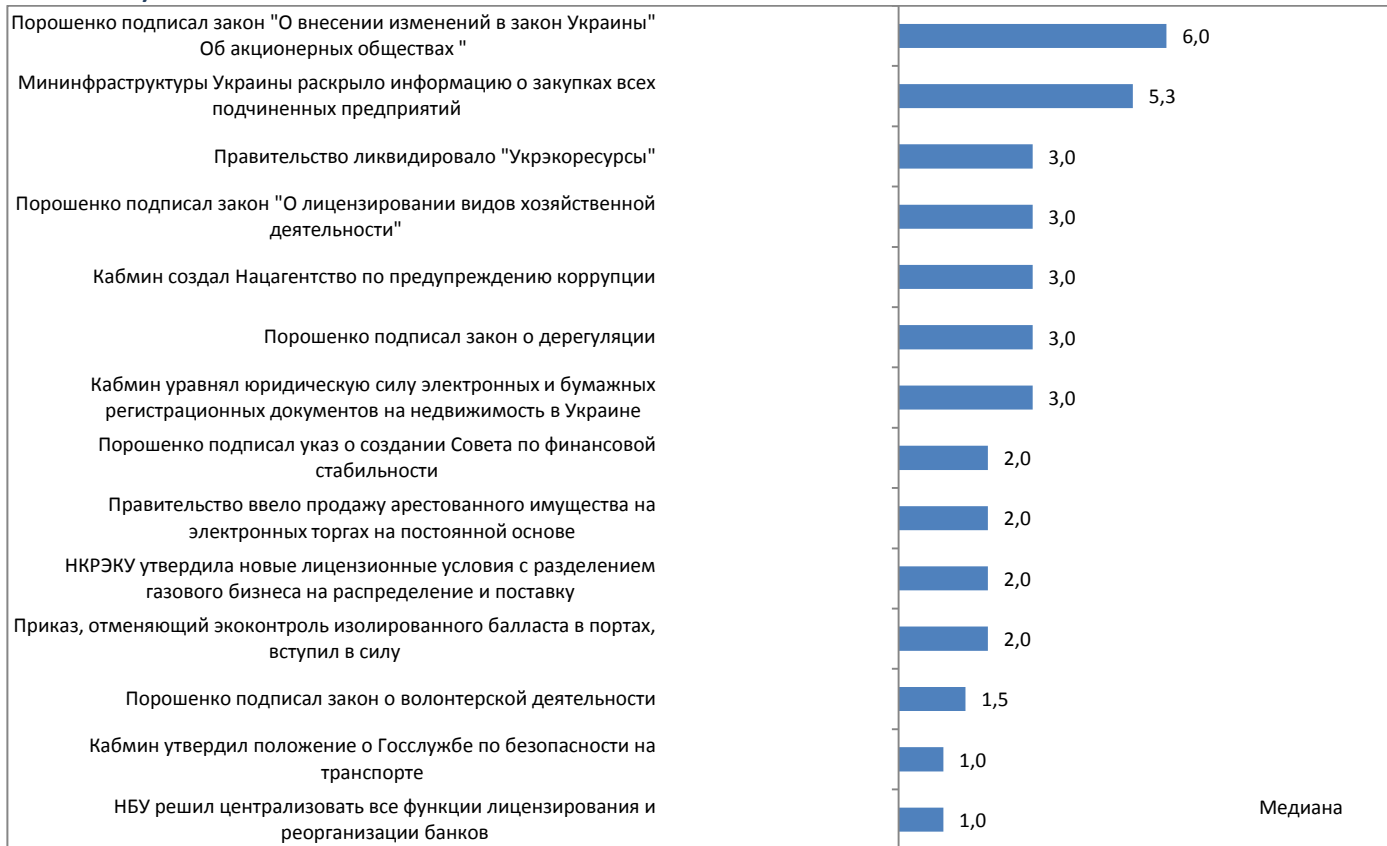
График 4. События, которые определяли значение индекса за период с 23 марта по 5 апреля 2015г. (оценка события является суммой ее оценок по разным направлениям, поэтому она может превышать +5, или быть меньше -5)

Период мониторинга: 23 марта – 5 апреля 2015 г.