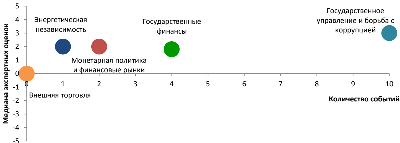
Таблица 1. Оценки всех событий и прогресса реформ по направлениям за период 23 марта – 5 апреля 2015г.